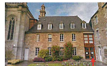
(Entrée à gauche de la médiathèque)

PSYCHOLOGUES INFORMATIONS CONSEIL ÉLÈVES GRATUIT JEUNES PARENTS ÉTUUDIANTS EDUCATION CIO NATIONALE COACHING ADULTES ORIENTATION ACCOMPAGNEMENT ENTRETIENS